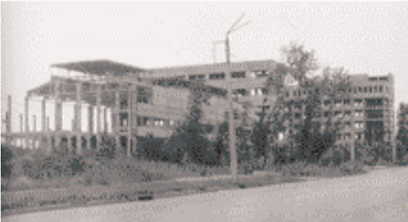
ОНБ «Макаронна фабрика»