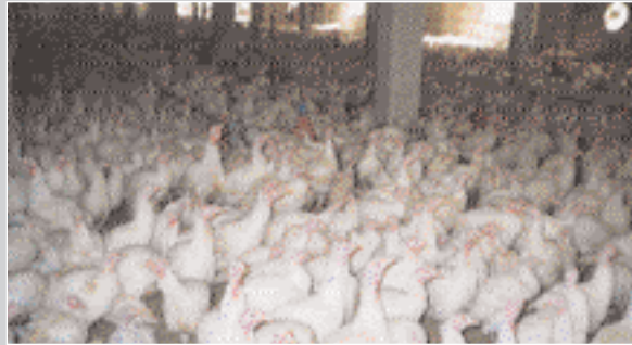
Племінний завод з розведення індичок

вого навісу, одноповерхової будівлі, контори та п'яти складських приміщень. Будівництво розпочато у 1991 році та припинено у 1994 році. Загальна будівельна готовність – 75 %. Об'єкт проданий у 2000 році.