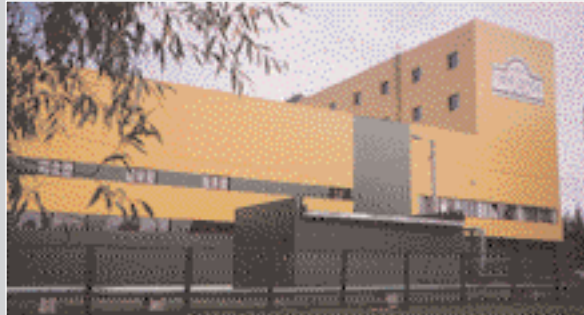
Чаетрозважувальна фабрика «АНМАД ТЕА»

ності продажу ОНБ є не сума надходжень до державного бюджету, а завершення будівництва новим господарем.