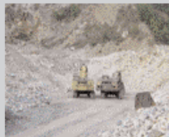
Мармуровий кар'єр «Трибушани»