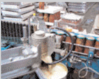
На ділянках ВАТ «Мукачівський консервний завод»

Поліпшили результати роботи у післяприватизаційний період ВАТ «Мукачівський завод «Точприлад», «Машинобудівний завод «Тиса», «Перечинський лісохімічний комбінат».