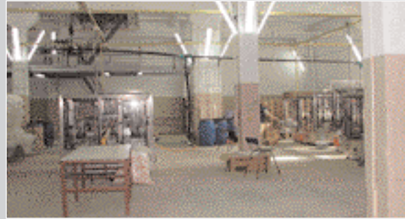
Цех «ЮСІ» з виготовлення полімерних виробів для парфумерної і косметичної галузей промисловості

Комплекс складається з одноповерхових будівель каркасного типу: пташника з двома прибудованими приміщеннями та окремої будівлі. Загальна площа забудови – 1 600 м 2 . Будівництво розпочато і припинено у 1986 році. Об'єкт проданий у 1997 році.