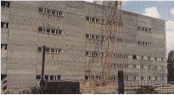
ОНБ «Блок механізованих складів»