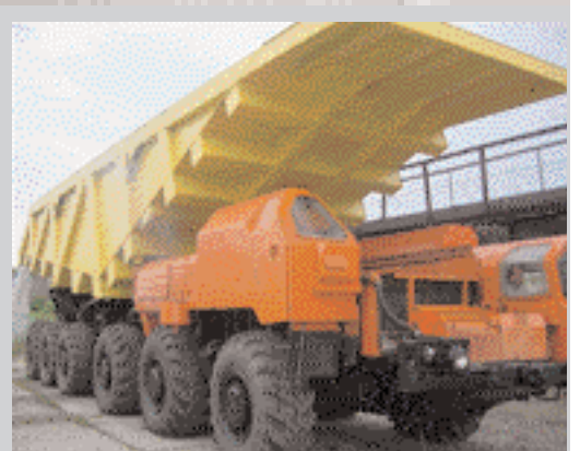
Важкий самоскид вантажопідійомністю 55 т на базі шестисьового ракетного тягача МАЗ 547