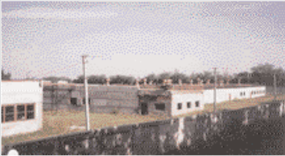
ОНБ «Інкубаторій на 15 інкубаторів»